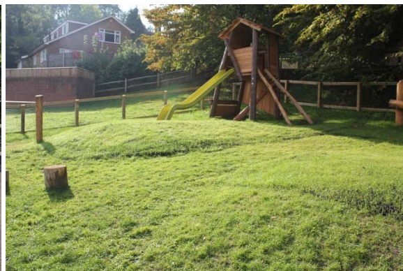
Wygląd po 4 tygodnie.