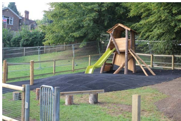
Wygląd bezpośredni po montażu